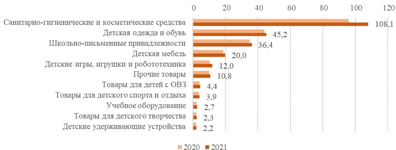
Прогноз производства товаров для детей в 2021 г., млрд руб.

Объем рынка товаров для детей в 2020 году составил 832 млрд рублей (2019 г. – 843 млрд рублей), при этом на 1 600 российских производителей пришлось 228 млрд рублей.